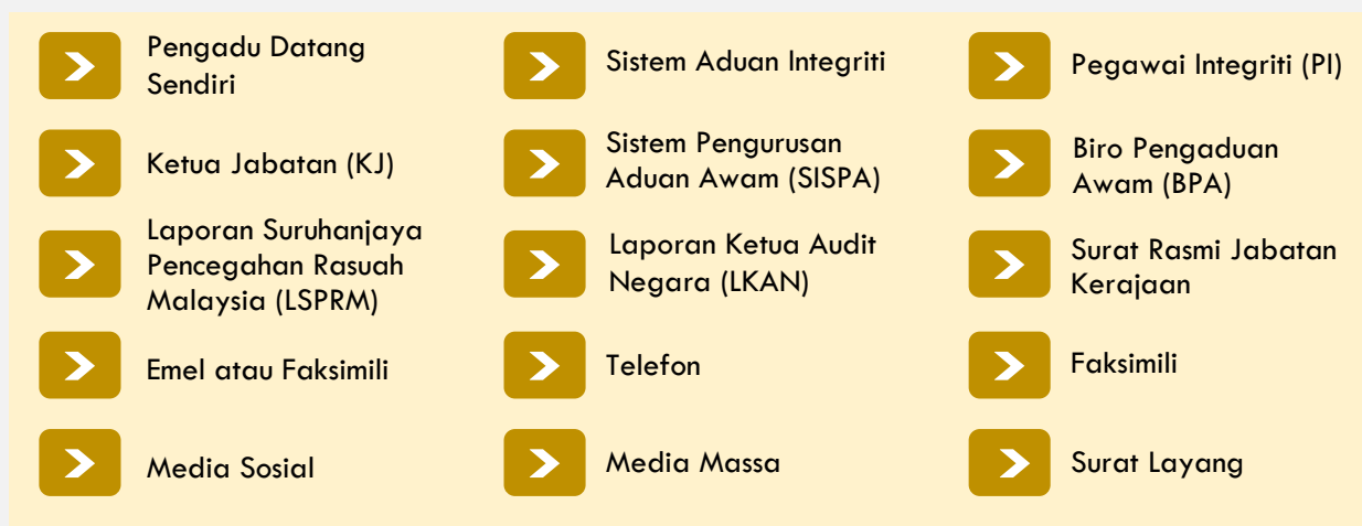
Rajah 3: Sumber Aduan/ Maklumat