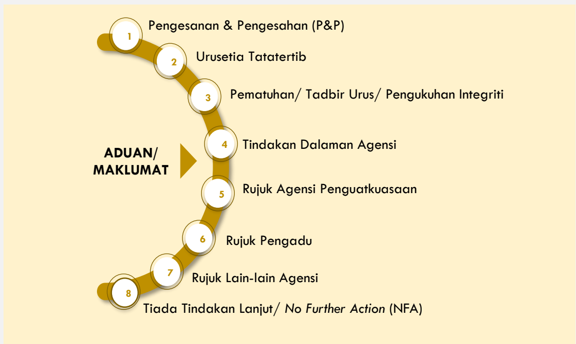
Rajah 4: Tindakan ke atas Aduan/ Maklumat

Tindakan yang diputuskan oleh JMM ke atas aduan/ maklumat yang diterima adalah seperti di Rajah 4 .