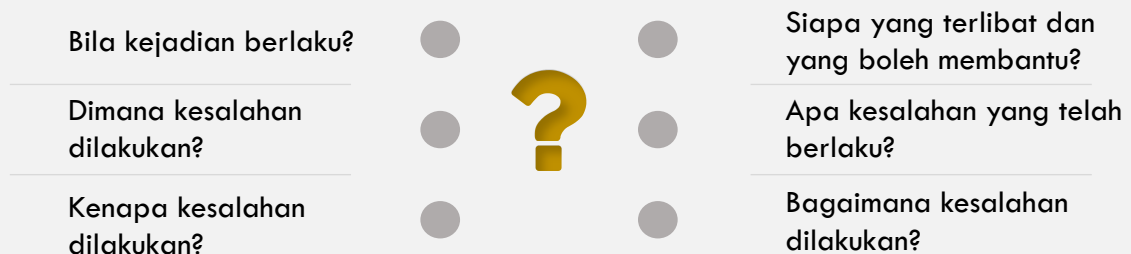
Rajah 2: Inti pati Aduan/ Maklumat

Aduan/ maklumat hendaklah mengandungi inti pati seperti di Rajah 2 .